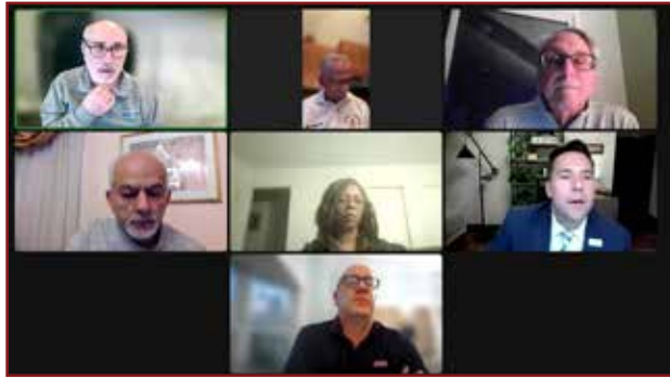
Los miembros del Concejo Municipal celebraron la segunda de dos sesiones virtuales sobre el presupuesto el 19 de marzo.

Es posible que se vislumbre un aumento en las tarifas de los servicios públicos de agua del municipio.